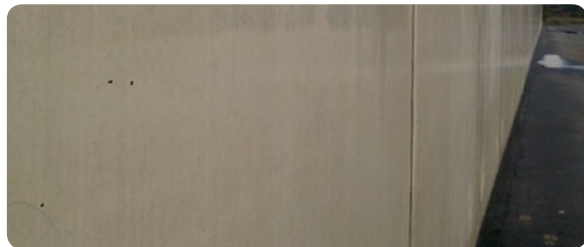
Mit Controll®Innerseal behandelter Beton