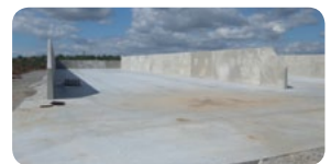
Beispiele für Anlagen aus Beton