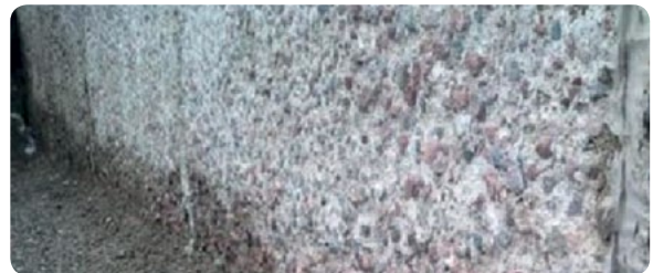
Das typische Schadensbild, wenn der Betonschutz versagt hat - ein Sanierungsfall

Für die fachgerechte Ausführung, in Verbindung mit unseren Produkten, werden ausschließlich von uns zertifizierte Unternehmen eingesetzt: