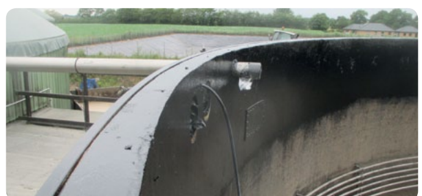
Beispiel eines sanierten Betons