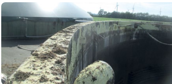
Beispiel eines geschädigten Betons